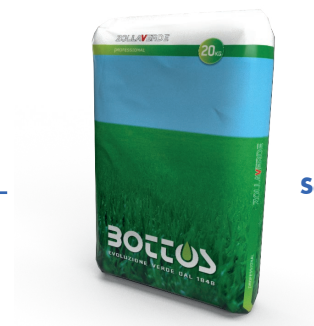
Sacco da 20 Kg